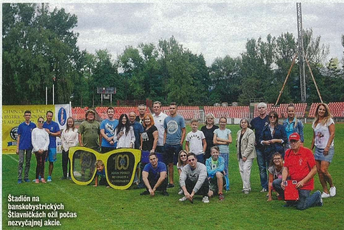
Štadión na banskobystričských Štiavnickách ožil počas nezvyčajnej akcie.

kým o najmenej rozvinutých krajinách sveta, cestu k nej má otvorenú aj hociktorý Európan. „Pokiaľ príde taká požiadavka a dotýčny nemá inú možnosť, ako sa k okuliárom dostať, aj