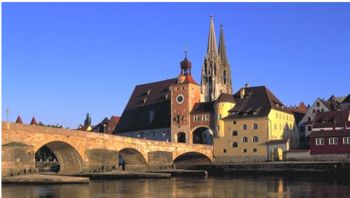
Kamenný most a dóm v Regensburgu

Perfektná kulisa pre naše partnerské stretnutie – srdečne Vás pozývame!