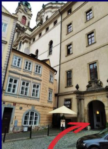
Hlavní vchod, (dále do průchodu a doleva dolů po schodech)