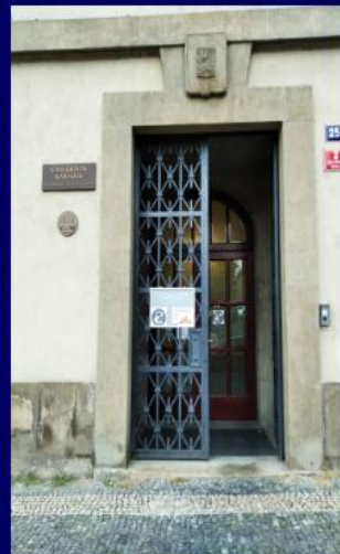
Vedlejší vchod (na konci chodby vpravo je výtah dolů. .) .

QR kód pro úhradu – prosím upravte částku a zprávu pro příjemce – jméno a počet osob.